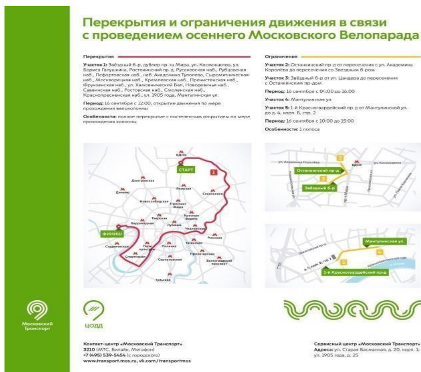
Рисунок 2. Маршрут осеннего Московского Велопарада и схемaperекрытий/ограничений движения 2